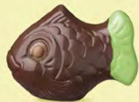
Praliné croustillant aux éclats de crêpe dentelle