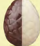
Praliné avec éclats de noisettes