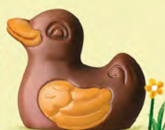
Praliné avec sucre pétillant