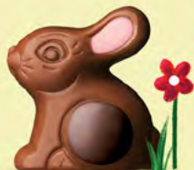
Praliné et riz soufflé