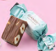
Chocolat au lait