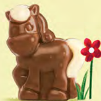
Moelleux au chocolat