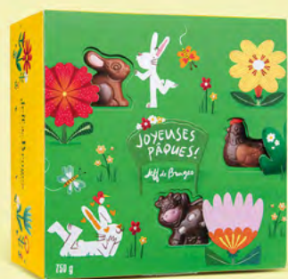
LE BALLOTIN DE 750 G 60 CHOCOLATS ASSORTIS