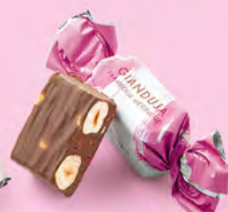
Framboise & meringue