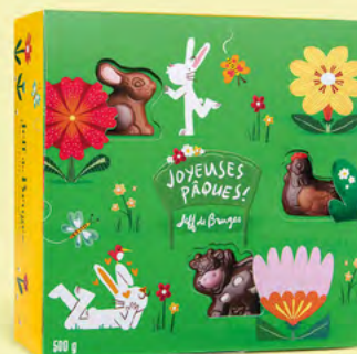
LE BALLOTIN DE 500 G 40 CHOCOLATS ASSORTIS