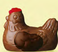
Duo praliné et ganache caramel