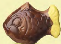
Praliné et noix de coco caramélisée