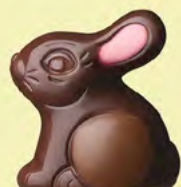
Praliné et éclats de noisettes caramélisées